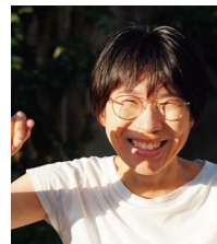
今村 彩子氏 Studio AYA 代表 映画監督